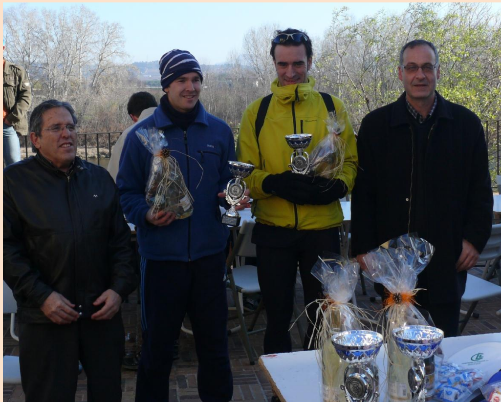
Memòria de la temporada 2009 25è aniversari