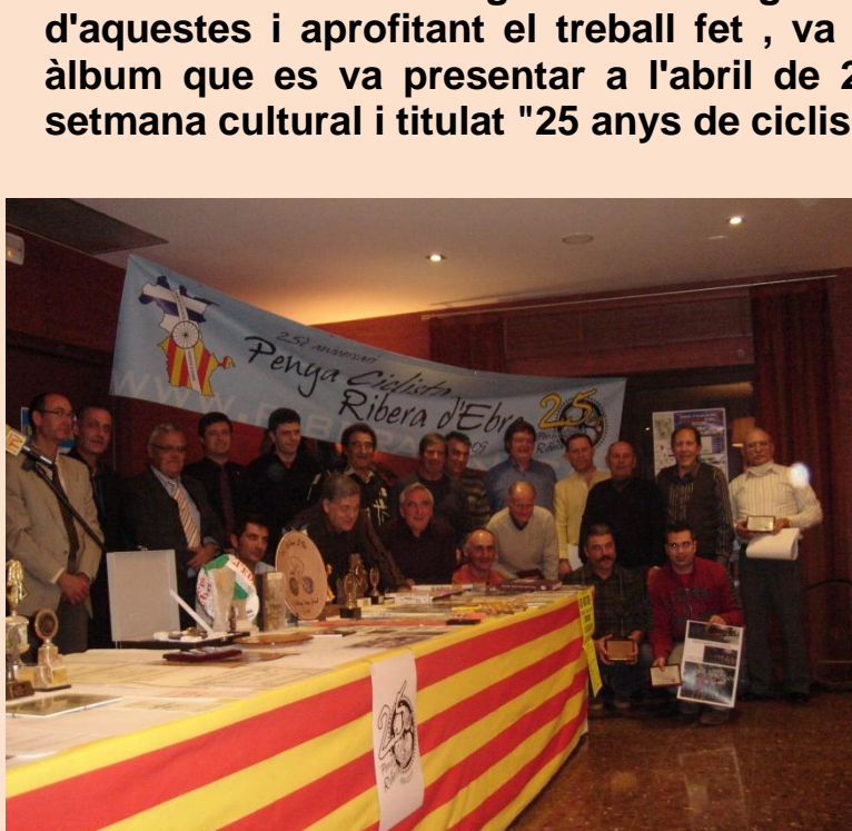
Memòria de la temporada 2009 25è aniversari