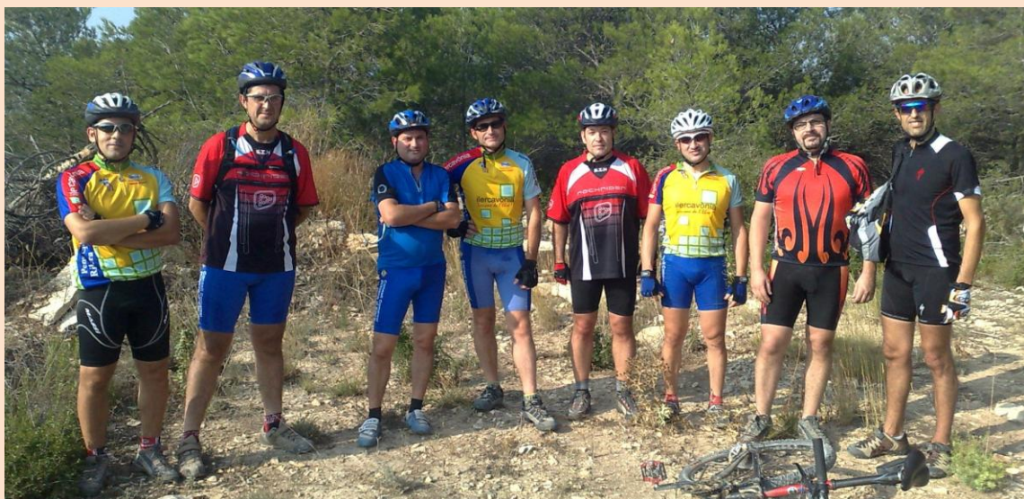
Memòria de la temporada 2009 25è aniversari