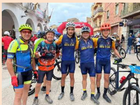
Memòria de la temporada 2024