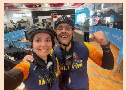
Memòria de la temporada 2024