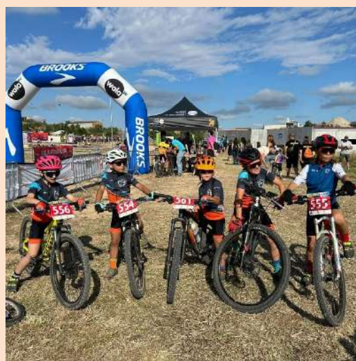
Memòria de la temporada 2024