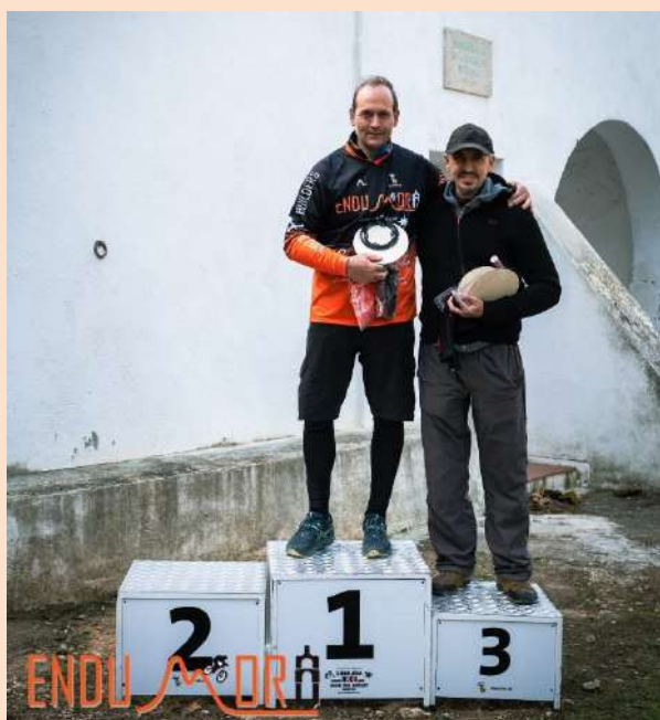
Memòria de la temporada 2024